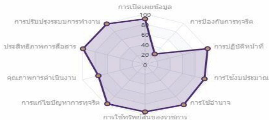
รูปที่ 1 ผลประเมินภาพรวมการประเมินคุณธรรมและความโปร่งใสในการดำเนินงานของภาครัฐ (ITA) ประจำปีงบประมาณ พ.ศ. 2568 วิทยาเขตเชียงราย มหาวิทยาลัยพะเยา